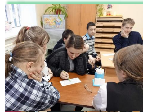
ГОКУ ИО «СКШИ № 19 г. Тайшета»