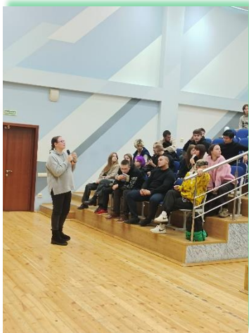
ФГБОУ ПОО «Государственное училище (колледж) олимпийского резерва г. Иркутска»