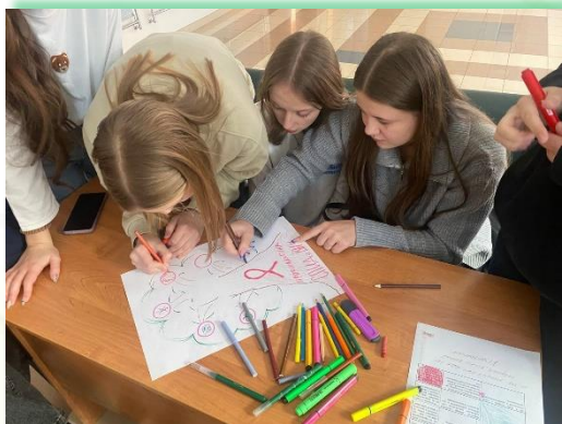
ГАПОУ ИО «Иркутский технологический колледж»