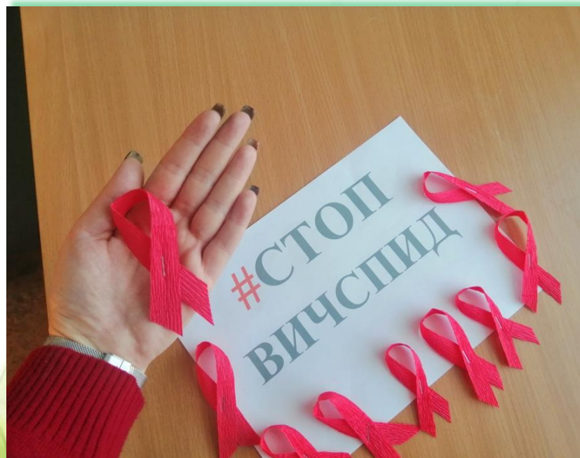
Частное общеобразовательное учреждение "РЖД лицей № 14" г. Иркутск