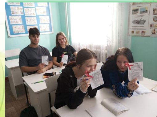
ГБПОУ ИО «Тайшетский промышленно- технологический техникум»