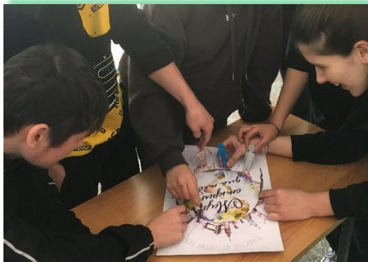
ГАПОУ ИО «Ангарский техникум строительных технологий»