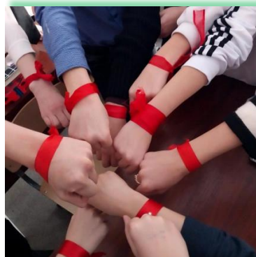
Муниципальное образование «Нижнеудинский район»