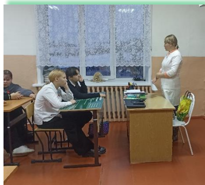
Муниципальное образование «Аларский район»