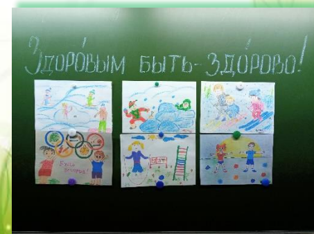
ГОКУ ИО «Специальная (коррекционная) школа № 33 г. Братска»