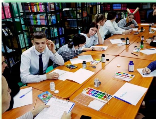
ГБПОУ ИО «Химико-технологический техникум г. Саянска»