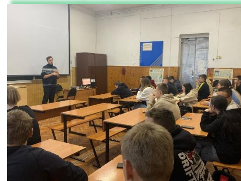
ГБПОУ ИО «Иркутский авиационный техникум»