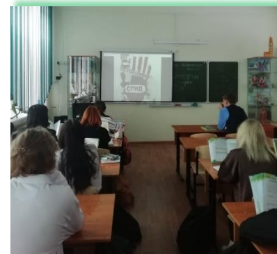
Муниципальное образование «Ангарский городской округ»