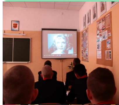
ГОБУ ИО «Иркутский кадетский корпус имени П.А. Скороходова»