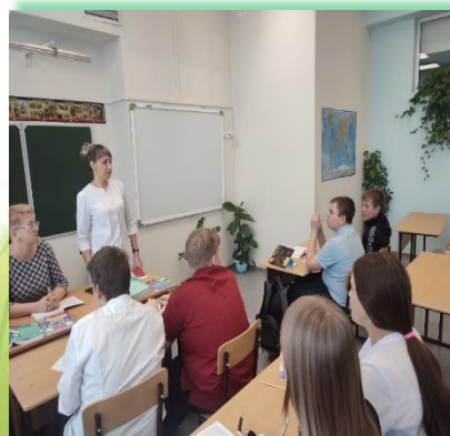
Муниципальное образование «город Свирск»