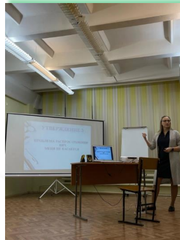
Братский целлюлозно-бумажный колледж ФГБОУ ВО «БГУ»