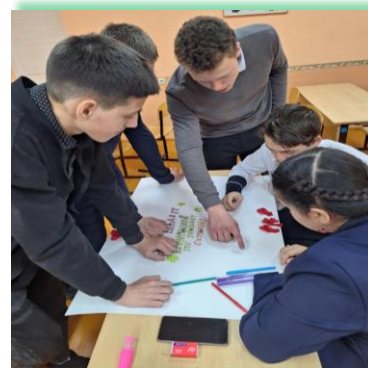
Иркутское районное муниципальное образование