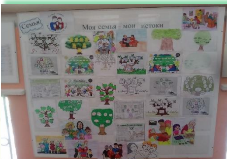
ГОКУ ИО «Специальная (коррекционная) школа- интернат № 6 г. Нижнеудинска»