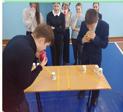
Муниципальное образование «Слюдянский район»