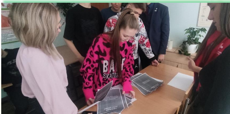
ОГБПОУ «Саянский медицинский колледж»