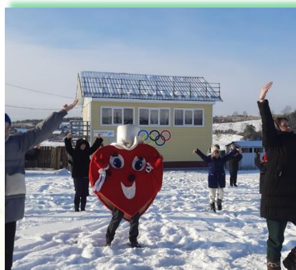
Усольское районное муниципальное образование