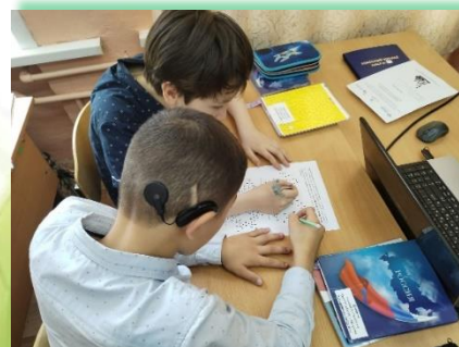
ГОКУ ИО «Специальная (коррекционная) школа № 11 г. Иркутска»