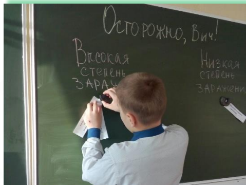
ГОКУ ИО «СКШИ №1 г. Ангарска»