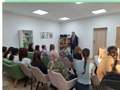
ГОКУ ИО «СКШИ для обучающихся с нарушениями зрения № 8 г. Иркутска»