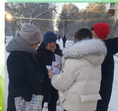
Муниципальное образование «город Саянск»