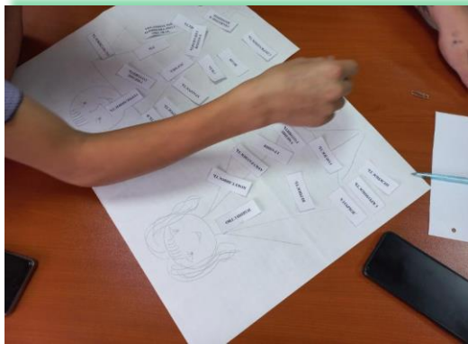
ГАПОУ ИО «Братский индустриально- металлургический техникум»